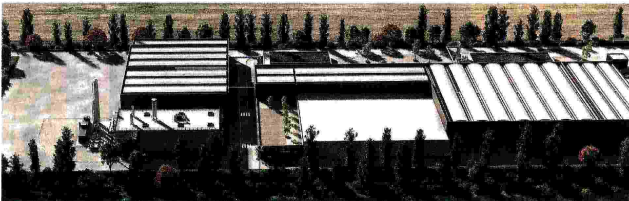
Render grafico di un impianto per la produzione di biometano e compost