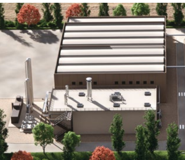
digestore anaerobico e sezione di upgrading

Il biometano è un combustibile verde utilizzato per produrre energia elettrica e calore e come carburante per l'autotrazione, mentre il compost è un ammendante naturale, ottimo sostituto dei fertilizzanti chimici. Con il recupero di materia sotto forma di biometano e compost il rifiuto organico viene trasformato in risorsa e immesso nuovamente nel ciclo produttivo, andando così a chiudere quel cerchio a cui si fa riferimento quando si parla di economia circolare .