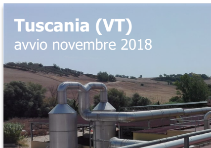
Tuscania (VT) avvio novembre 2018

Capacità trattamento FORSU 40.000 t VERDE 13.500 t Produzione biometano 4 mln Sm 3