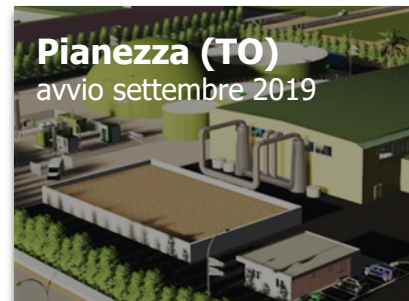
Pianezza (TO) avvio settembre 2019

Capacità trattamento FORSU 40.000 t VERDE 14.000 t Produzione biometano 3,5 mln Sm 3