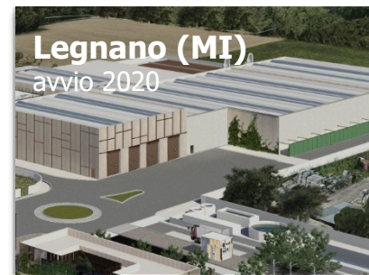
Legnano (MI) avvio 2020

Capacità trattamento FORSU 40.000 t (in ampliamento) Produzione biometano 4 mln Sm 3