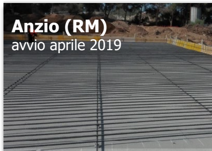
Anzio (RM) avvio aprile 2019

Capacità trattamento FORSU 40.000 t VERDE 10.000 t FANGHI 10.000 t Produzione elettrica 6.500 MWh