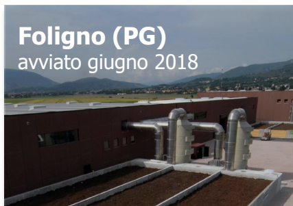
Foligno (PG) avviato giugno 2018

Capacità trattamento FORSU 40.000 t VERDE 13.500 t Produzione biometano 4 mln Sm 3